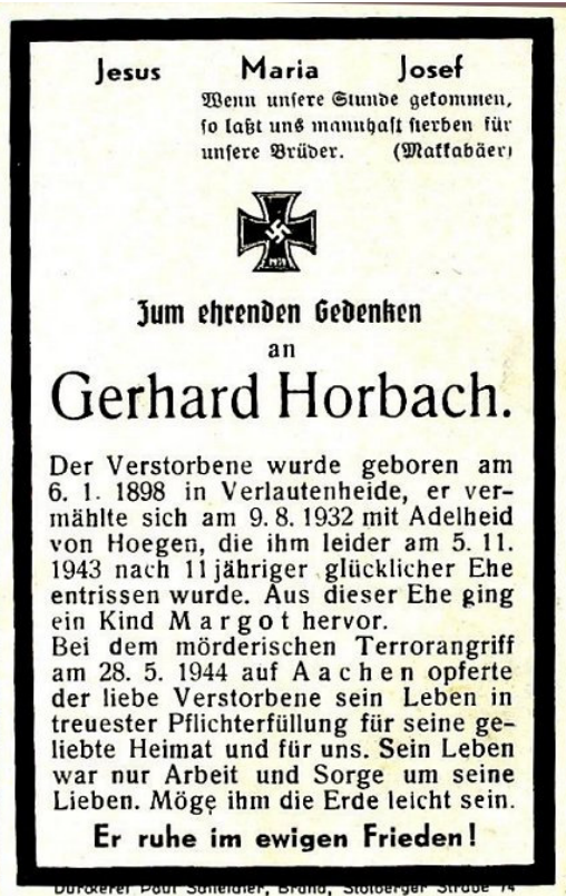
Totenzettel können bei der Familienforschung sehr hilfreich sein.

ziemlich beschäftigt mit meinen ständigen Anfragen und konnte auch nicht immer helfen ohne Daten.