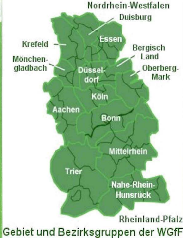
Gebiet und Bezirksgruppen der WGfF