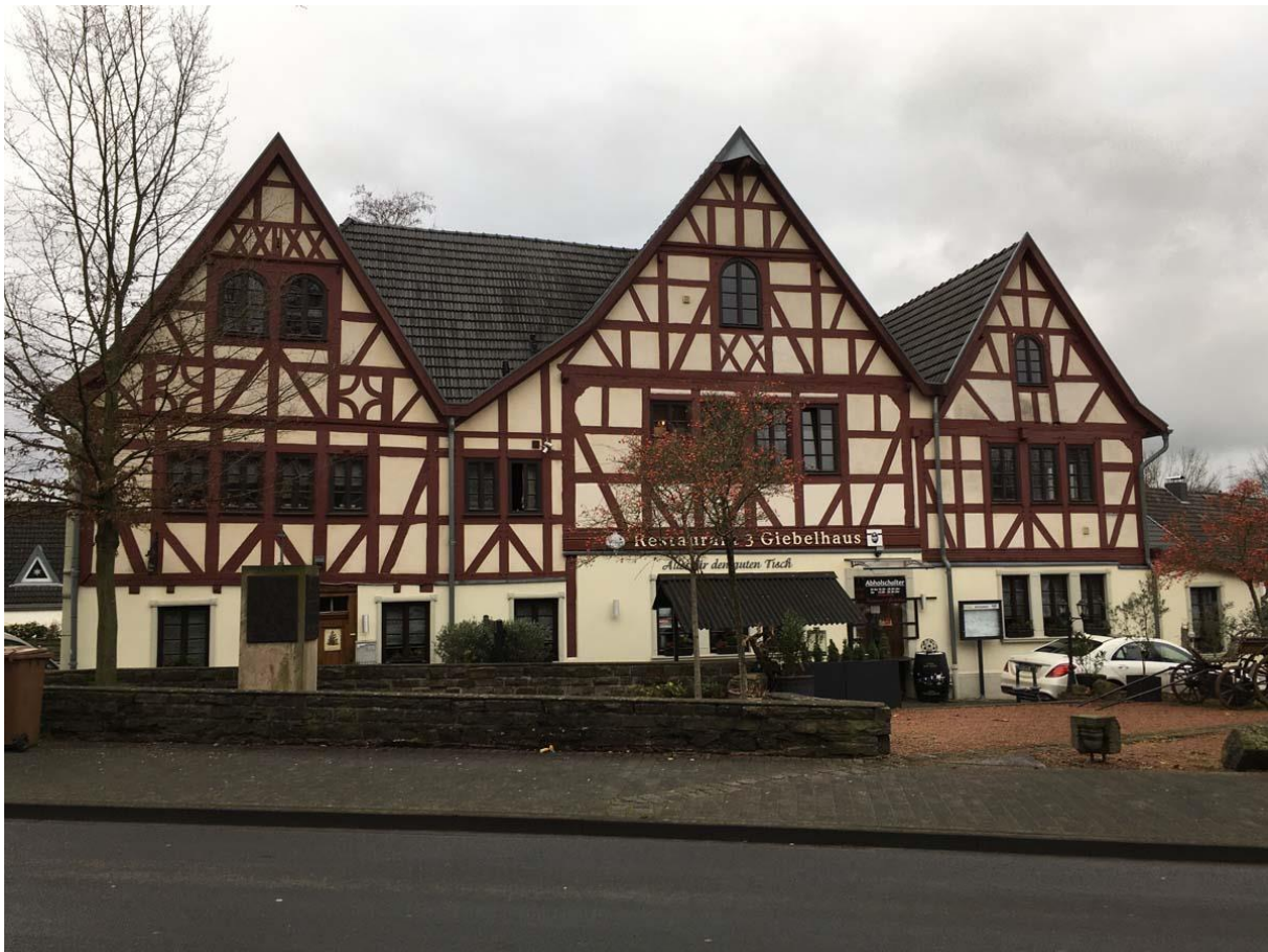
Dreigiebelhaus in Hennef-Warth