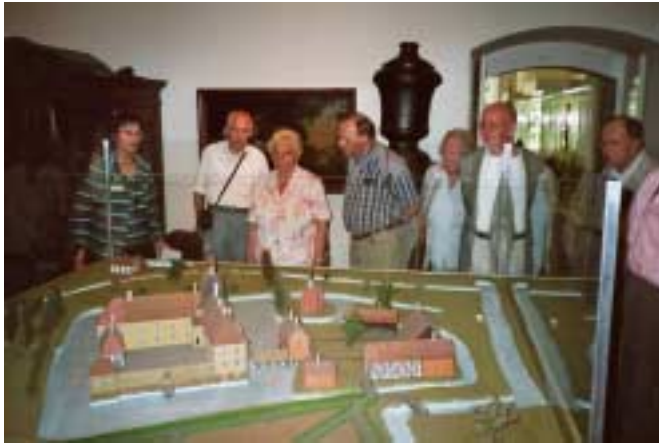
Ein Teil der Gruppe vor einem Modell des Schlosses

Im Juni trafen sich Mitglieder der Bezirksgruppe vor dem Schloss Strünkede, um Einiges zu der Geschichte des Hauses und seiner Bewohner, besonders des Ritters von Strünkede, zu erfahren.